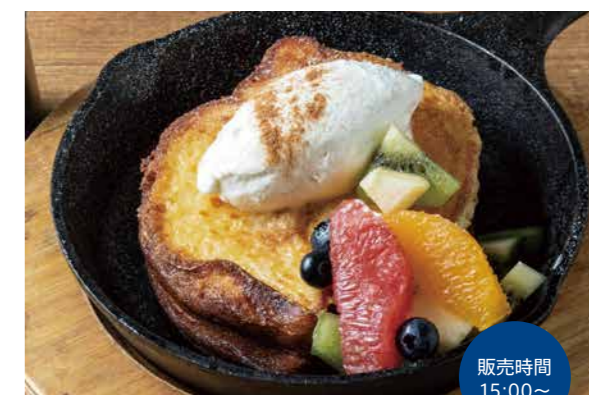
ブリオッシュフレンチトースト 950

マスカルポーネの濃厚なクリームと、スロージェットコーヒーの エスプレッソを加えたオリジナルティラミス