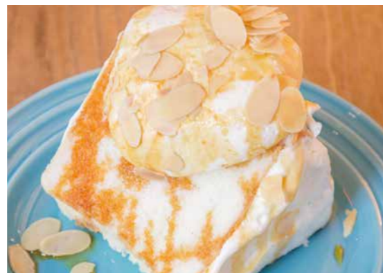
エンゼルフードケーキ バニラキャラメル 780