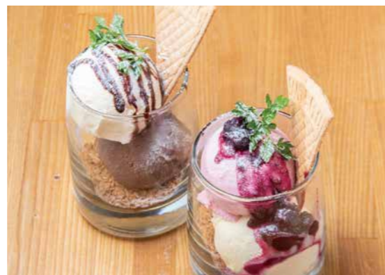
アイスの盛り合わせ 680