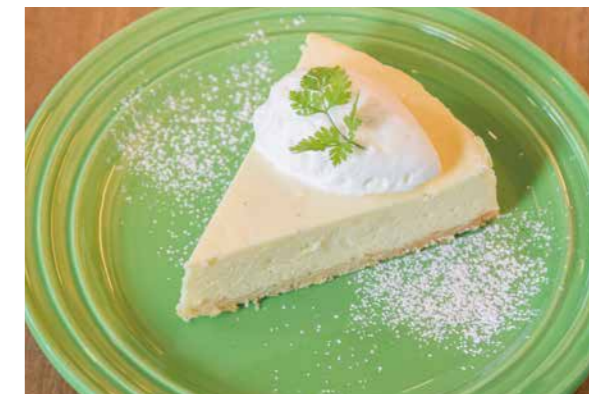
シェフ特製チーズケーキ 780